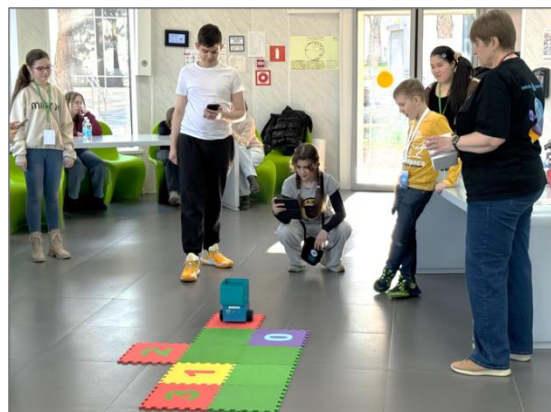
Рис. 3. Управление реальным роботом Ползуном

Подход второй — форма подачи. От традиционных лекций почти отказались, сделав ставку на викторины, практику в «ПиктоМире» и соревнования. Результат — дети не заскучали и сохранили внимание на все 14 дней интенсива (рис.3).