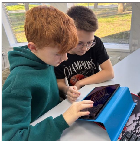
Рис. 4. Соревнование по кооперативному программированию

Формат соревнования предполагал работу в парах, где участники совместно решали задачи в среде «ПиктоМир» (рис. 4).