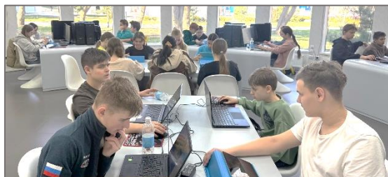
Рис. 2. Школьники выполняют практические задания

Занятия проводились (рис. 2) на базе оборудования, предоставленного ВДЦ «Смена» (16 стационарных ПК, 2 телевизора) и НИЦ «Курчатовский институт» (15 планшетов Android с подставками, комплект «ПиктоМир», а также 2 преподавательских планшета).