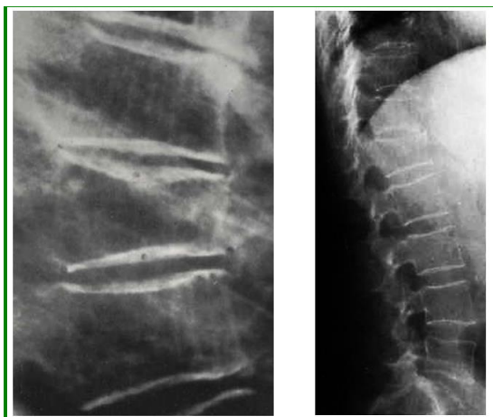
Рис. 7. Рентгенологическая картина остеопороза позвонков при традиционной рентгенографии

В нашем исследовании важным методом изучения МПКТ поясничных позвонков, шейки бедра и зоны треугольника Варда было использование рентгеновской денситометрии ДРА - двуэнергетической рентгеновской абсорбциометрии. При этом исследуется проекционная суммарная плотность костной ткани – трабекулярной и кортикальной. Использовался денситометр фирмы «Hologic». Протокол исследования приведен на рис. 8.